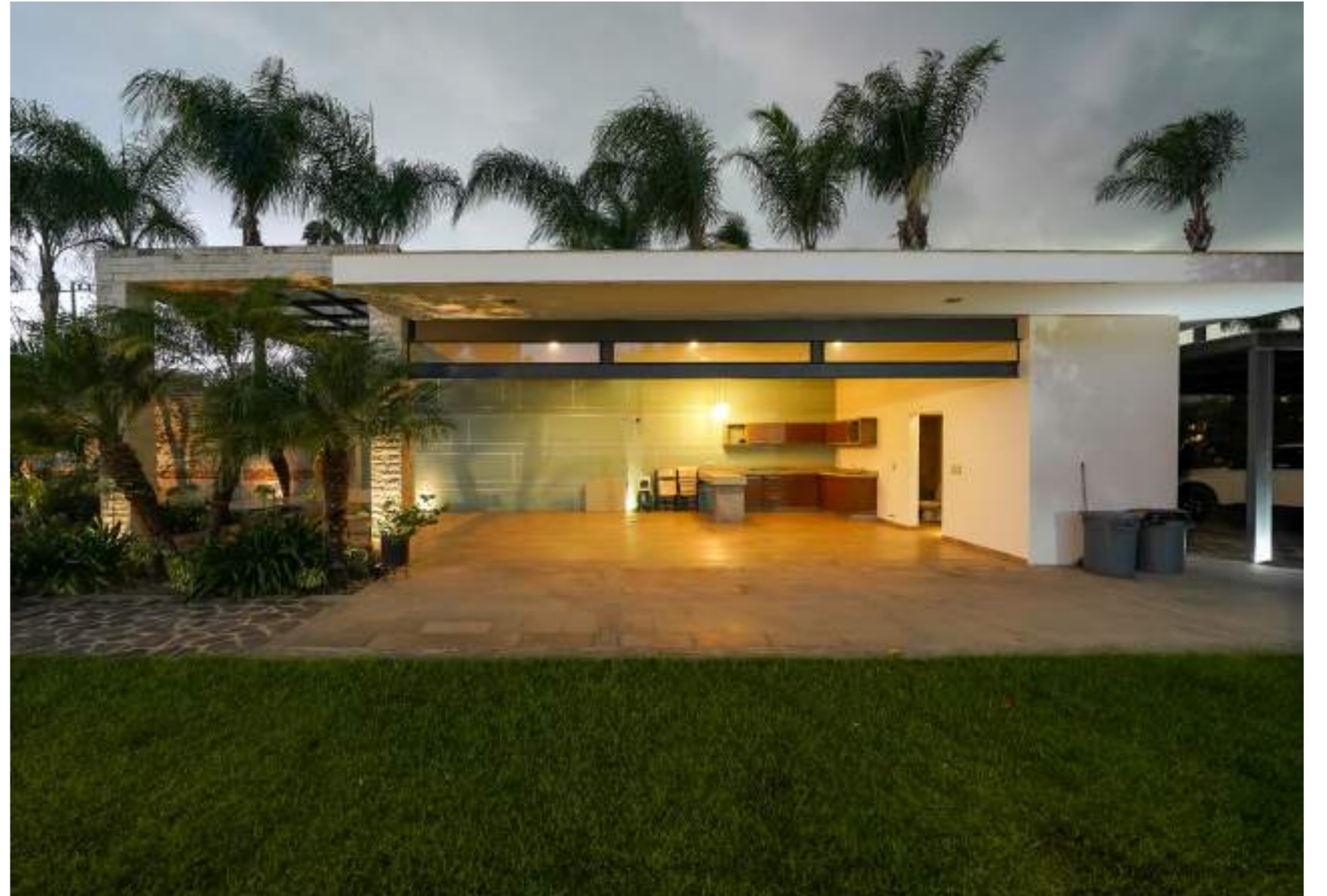
JARDÍN | TERRAZA