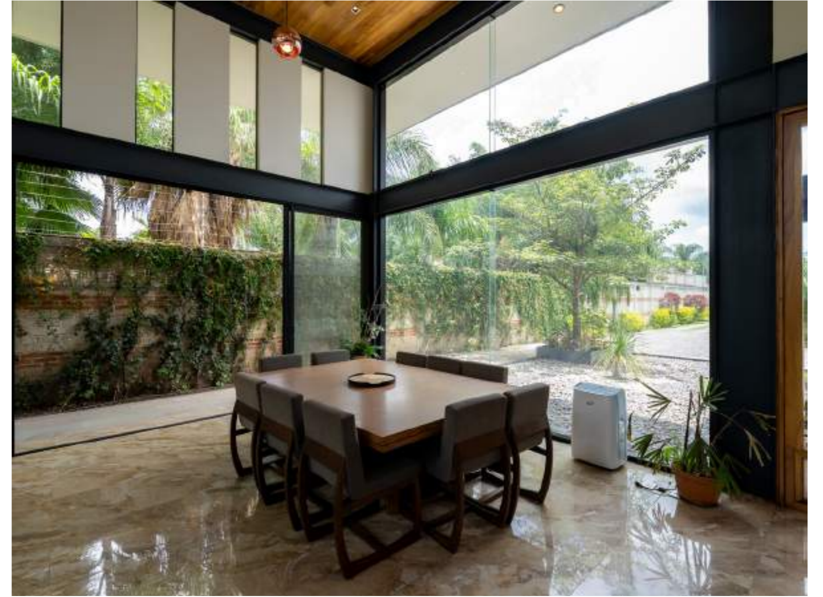
SALA | COMEDOR