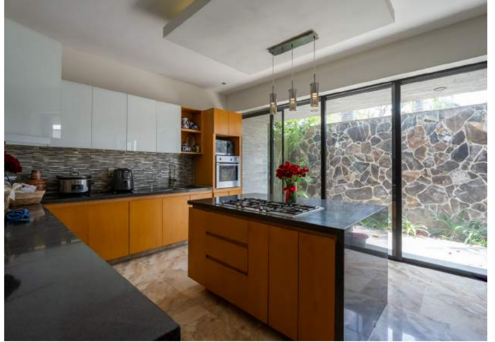
COMEDOR | SALA | COCINA